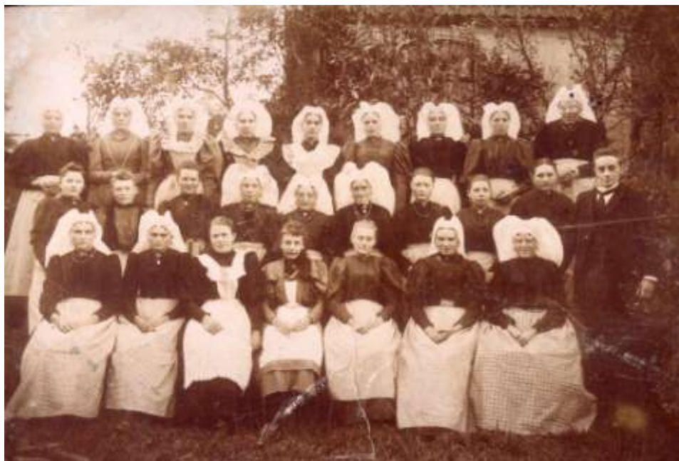
De boerenstand in Ouddorp, ca 1900, met vertegenwoordigers van diverse families.